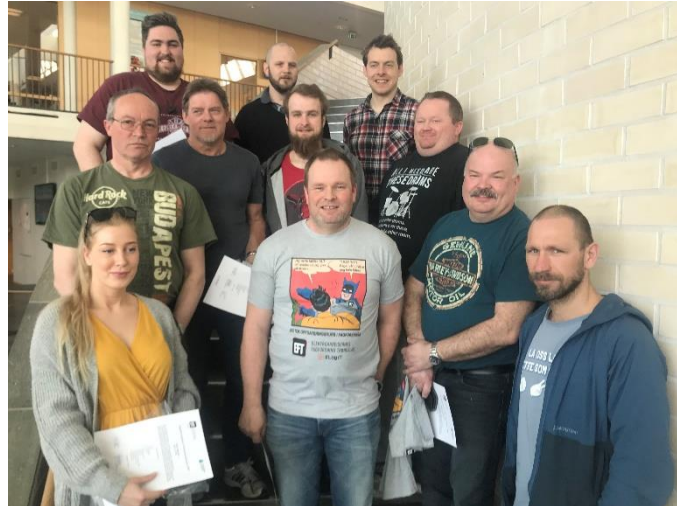
Deltagere på kurset i 2018

Målgruppen for kurset er montører med fagbrev innen Telekom (telekommunikasjonsmontør, telemontør, svakstrømsmontør, samt eldre fagbrev knyttet til samme bransje). Elektrikere som jobber innenfor området kan også delta. Kurset er åpent for alle EL og IT Forbundets medlemmer som går på Landsoverenskomsten for elektrofag.